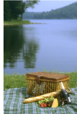
Pie de imagen o gráfico.

La mayor parte del contenido que incluya en el boletín lo puede utilizar también para el sitio Web. Microsoft Publisher ofrece una manera fácil de convertir el boletín en una publicación para el Web. Por tanto, cuando acabe de escribir el boletín, conviértalo en sitio Web y publíquelo.