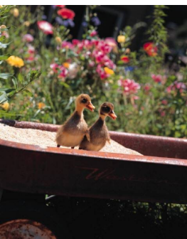
Pie de imagen o gráfico.

Este artículo puede incluir 175-225 palabras.