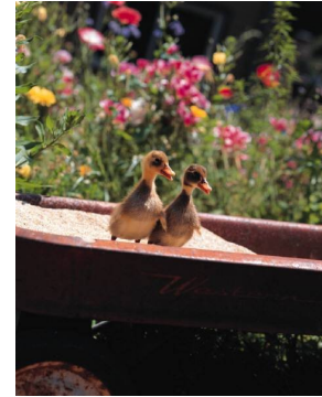
Pie de imagen o gráfico.

La mayor parte del contenido que incluya en el boletín lo puede utilizar también para el sitio Web. Microsoft Publisher ofrece una manera fácil de convertir el boletín en una publicación para el Web. Por tanto, cuando acabe de escribir el boletín, conviértalo en sitio Web y publíquelo.