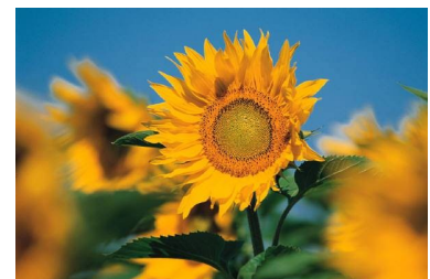
Pie de imagen o gráfico.

Una vez seleccionada la imagen, colóquela cerca del artículo. Asegúrese de que el pie de imagen está próximo a la misma.