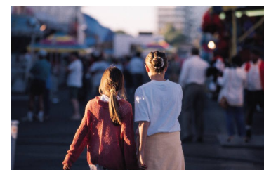
Pie de imagen o gráfico.

Una vez seleccionada la imagen, colóquela cerca del artículo. Asegúrese de que el pie de imagen está próximo a la misma.